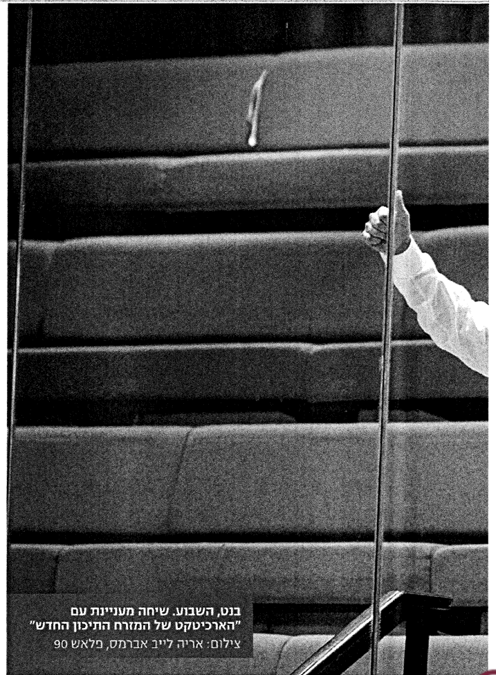
בנט, השבוע שיחה מעניינת עם הארכיבישקט של המזרח התיכון החדש"