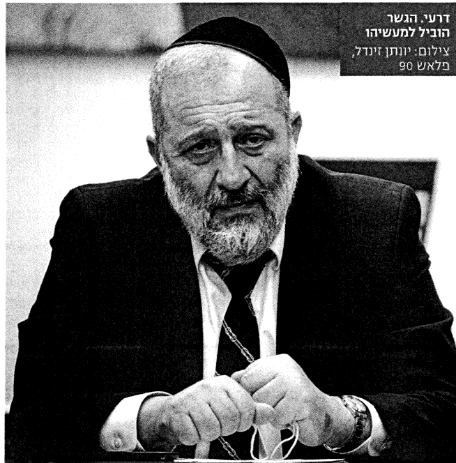
ד"ר. הגשר הוביל למעשיהו

בוודאות שהרחיפה לקיומה של הילולה מירון במתכונת הרגילה שלה, ללא הגבלות כלשהן, הגיעה מרדעי. היו עדים שטענו שמדובר גם בלחץ מאסיבי של השר לביטחון הפנים אמיר אוחנה. היו עדים שאמרו שמאחורי שני אלה היה לחץ כבר של נתניהו. המעורבות של רדעי לקיים את ההילולה בלי הגבלת כניסה עולה בעדויות הללו בבירור. על פי היועמ"שית של משרד הדתות, רדעי "ביטל" את השר המכהן במשרד, נכנס לנעליו וניהל את העסק. נרמה לי שהמסקנה שאליה הגעתי לגיטימית וחוסה בגבולות חופש הביטוי והרעה. ייתכן שהשפה הייתה ציורית מדי. הדם מרוח וגו'. בתכל'ס, הכוונה ברורה: על פי העדויות עד כה, אריה רדעי, לעניות דעתי שאינה קובעת, הוא אחד האשמים באסון מירון. בדו"ח, הבנתי את הזעם הקדוש של רדעי, שירה בי עורך דין שמתמחה באיומי תביעה ותביעות השתקה. הוא ידע שבסבוע שעבר שהוא ברגעים הכי דרמטיים של מו"מ לעסקת טיעון באישומים החרשים שנחקרים נגדו. המשפט שכתבתי בא לו כטיימינג רע. פרקליטו התרעם גם על כי כניתי את רדעי "עברייני מורשע". במקרה הזה, הוא צדק. הכינוי המדויק הזה הוא "עברייני סדרתי מורשע". אם אכן יחתום על עסקת הטיעון המדוברת, זו תהיה כבר הרשעתו השנייה.